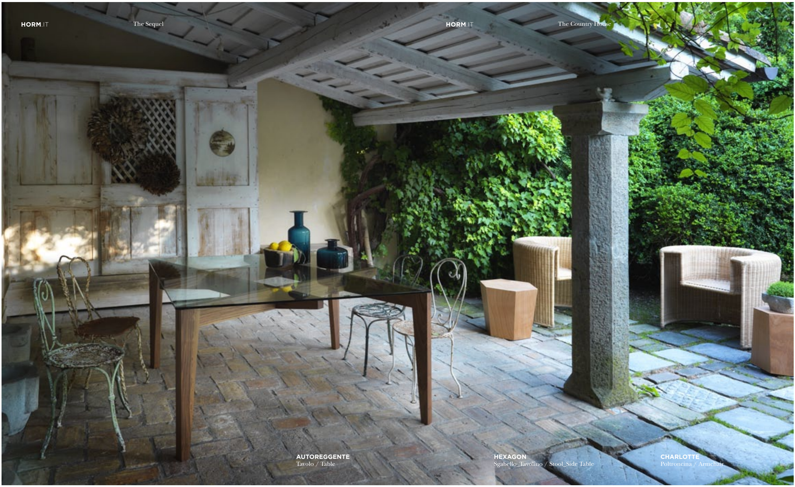
AUTOREGGENTE Tavolo / Table