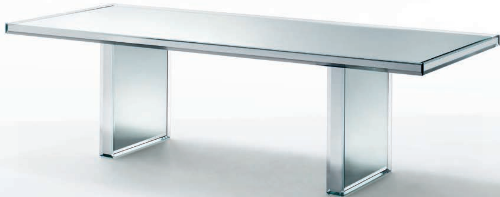
Table in transparent extralight 12 mm thick silver plated glass. Thanks to the reflections of the mirror and to the special grinding and bevelling of the glass edges, the table acquires a precious brilliance and shine. The bases are fixed to the top by means of metal plates and screws.

Tavolo in cristallo trasparente extralight 12 mm argentato. Grazie ai riflessi dello specchio e alle speciali molature e bisellature dei bordi del cristallo, il tavolo assume una preziosa luminosità e brillantezza. Le basi sono fissate al piano per mezzo di piastre metalliche e viti.